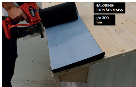
1. Montera Haloten® Fotplåtsremsa c/c 300 mm.