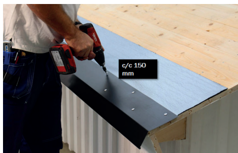
2. Montera plåten över Haloten® Fotplåtsremsa. Låt releasefilmen på Haloten® Fotplåtsremsa vara kvar vid montage av fotplåten.