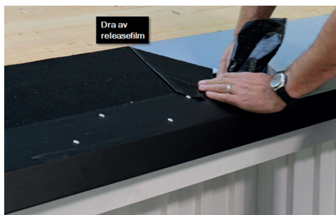
4. Dra av den uppskärade releaseremsan.