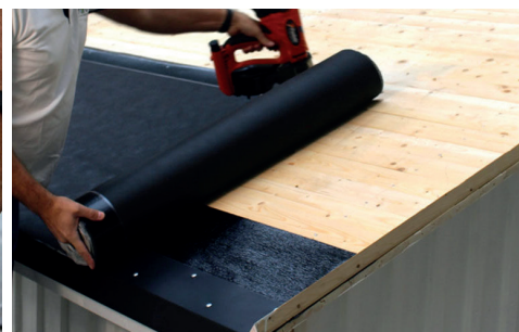
6. Rulla ut första våden underlagsduk och fäst i ovkant.