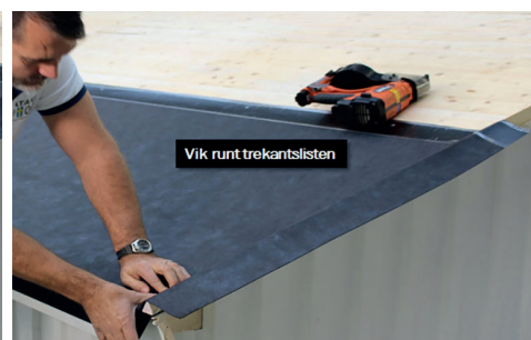
9. Tänk på att vika underlagsduken över trekantslisten och skär av längs med råspontens nedre kant.