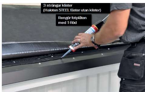
7. Vik upp nedersta kanten på första våden och lägg 3 strängar Matakli Asfaltklist längs plåten. Vid montage av Haloten® STEEL fäster dess klisterkanter utan klist mot fotplåten. Värm med varmluftpistol om det är kallt ute.