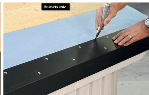
3. Använd baksidan på en kniv för att skära releaseremsan.