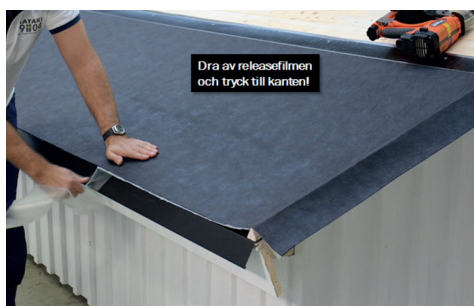
8. Dra därefter av releasen och tryck till för bra vidhäftning.