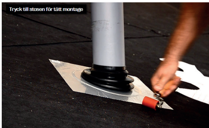
3. Fäst fast stosen ordentligt för ett tätt montage.