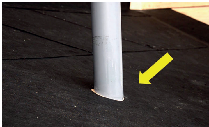
1. Gör hål för genomföringen.