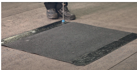
5. Fäst in rännalsvåden mekaniskt.