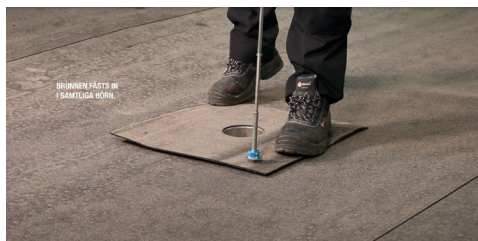
1. Fäst in takbrunnen i alla fyra hörnen.

För ytterligare information om montering, kontakta våra taktekniker.