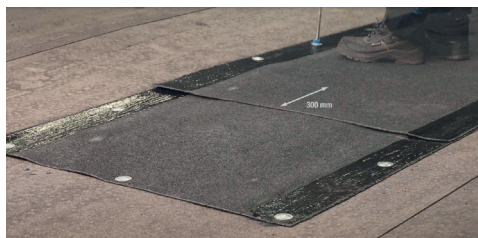
7. Skarvar i rännaldalar ska helsvetsas minst 300 mm. Alternativt förstärks skarvarna med en underliggande remsa av minst kvalitet YEP 3500, B=0,33 m och L=1 m. Den underliggande remsan ska helsvetsas mot de överliggande våderna. Rännalsvåd i anslutning till vertikal ska utformas så att rännalscentrum bildas minst 500 mm från den vertikala ytan.