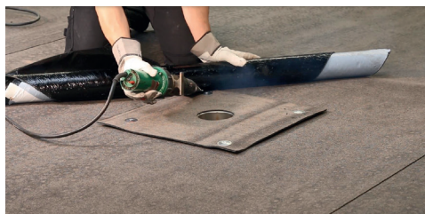
4. Rulla ut och helsvetsa rännalsvåden. Dra samtidigt av releasefilmen.