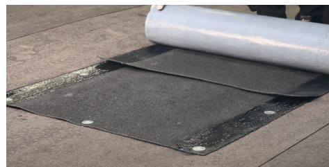
6. Anslut med Power RV. Ta bort releasefilmen i överlappet. Övrig releasefilm kan tas bort vid behov.