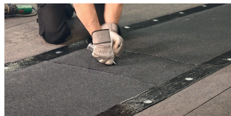
9. Skär ut hålet för brunnen med en varm kniv och montera lövfångarsilen.