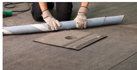
3. Rulla upp rännalsvåden för att komma åt att svetsa.