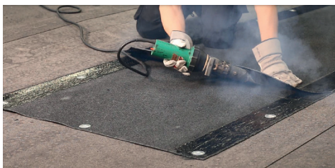
8. Helsvetsa rännalsvådens överlapp. Börja längst in och se till att kapsla in värmen för att uppnå bästa resultat.