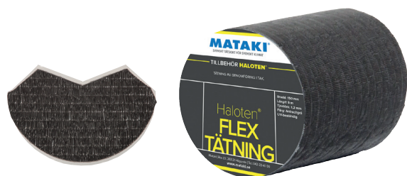
Flex tätning Flex tätning Hörn