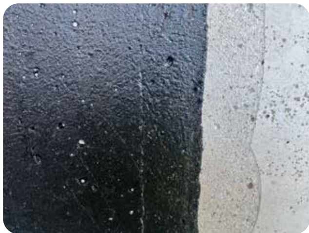
Betong som slipats till porer framträtt. Primer påfört och torkat. Ytterligare primer ska strykas för full täckning.

Applicering av tätskikt: När primern har torkat kan montage av tätskikt påbörjas.