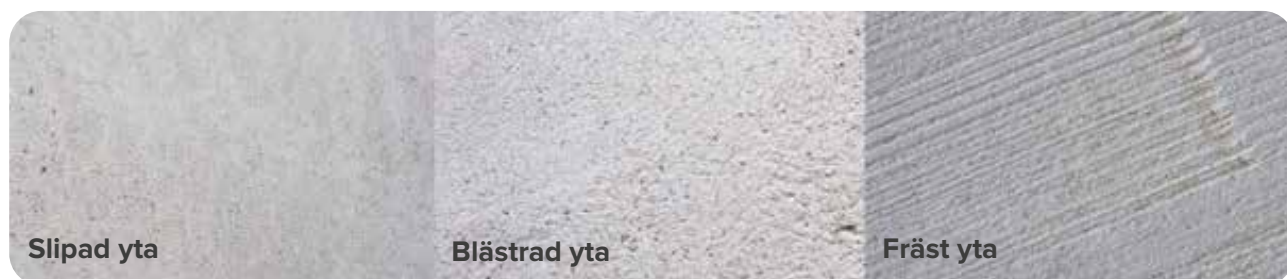
Exempel på olika behandlingar av betongyta.

När bitumenprimern appliceras på en yta avdunstar lösningsmedlet och lämnar efter sig en tunn, klibbig film av bitumen som fungerar som ett bindande skikt mellan underlaget och det efterföljande tätskiktet.