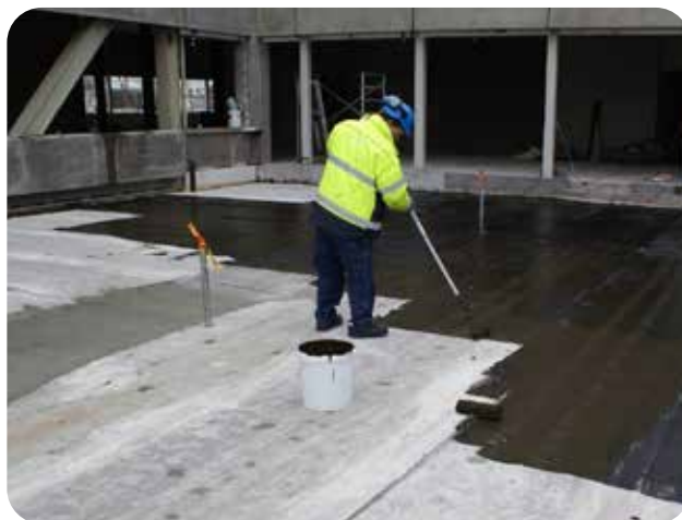
Strykning av ytan med primer. Beroende på underlagets beskaffenhet kan denna process få utföras i flera omgångar för att uppnå full täckning.