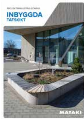
Projekteringsvägledning Inbyggda tätskikt