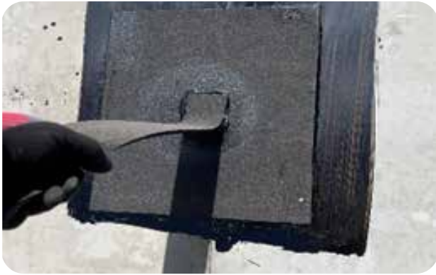
Dragprov utförs med handkraft vinkelrätt ut från underlaget. Vidhäftningsprov dokumenteras.