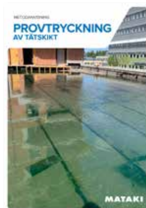
Metodanvisning Provtryckning av tätskikt