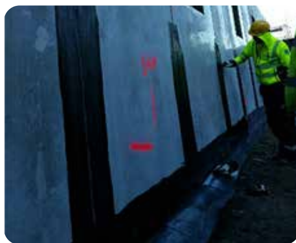
Exempel på ytor som inte tillräckligt bearbetats innan påförande av primer och tätskikt. Notera den blanka ytan.