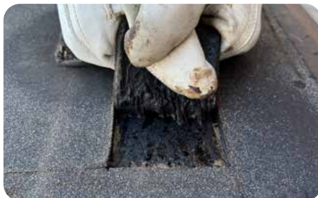
Vidhäftning kontrolleras genom att bitumentrådarna uppstår, och att remsan inte kan lossas med handkraft.