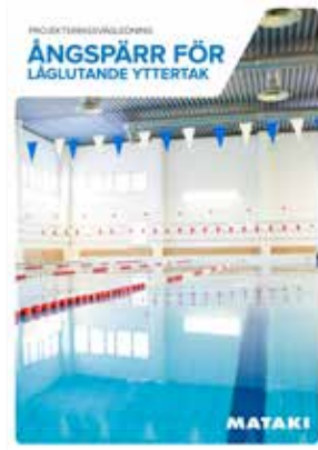
Projekteringsvägledning Ångspärr för låglutande yttertak