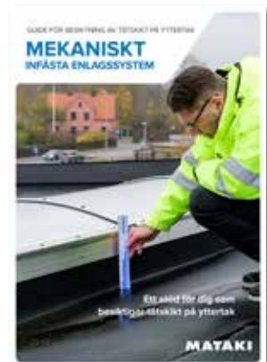
Guide för besiktning av tätskikt på yttertak