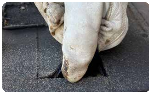
Remsan dras vinkelrät ut från underlaget.