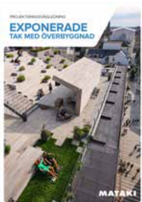
Projekteringsvägledning Exponerade tak med överbyggnad