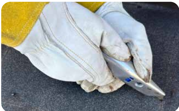
Remsa 25 x 500 mm skärs i underlaget.