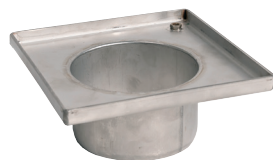
Ram Parking 401 Art.nr. 507991806601S