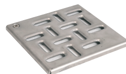
Silgaller Parking 401 Art.nr. 507991781101S