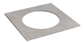
Förhöjningsring Parking 401 Art.nr. 507991806602S

Brunnen består av en underdel tillverkad i rostfritt syrafast stål (EN 14401) och en överdel 15 mm hög som sticks in i brunnen och kan justeras med förhöjningsringar (3 mm per ring - max 10 ringar totalt) för att nå önskad höjd. Brunnen förses med låsbart silgaller med belastningsklass L15.