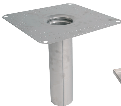
Brunn Parking 401 Art.nr. 50401004110